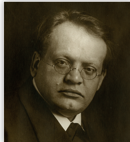
Max Reger im Jahre 1913

Mit Introduction, Passacaglia und Fuge op. 127 schuf Reger nach knapp zehnjähriger Abstinenz wieder ein Orgelwerk, an dem sich die Virtuosen abarbeiten konnten. Die Komposition steht in formaler Analogie zum letzten »Elefanten« dieser Art aus dem Jahr 1903, Variationen und Fuge fis-Moll op. 73. Wie dieses Werk, so hebt auch Opus 127 mit einer Einleitung in harmo-