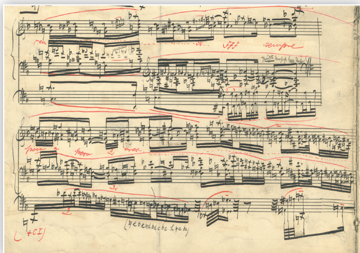
Symphonische Phantasie und Fuge für Orgel op. 57, Autographe Stichvorlage, Österreichische Nationalbibliothek, Wien, Signatur: L1.UE.410 (Dauerleihgabe der Universal-Edition an die ÖNB), Ausschnitt von fol. 2v [T. 5 und 6 der Phantasie].